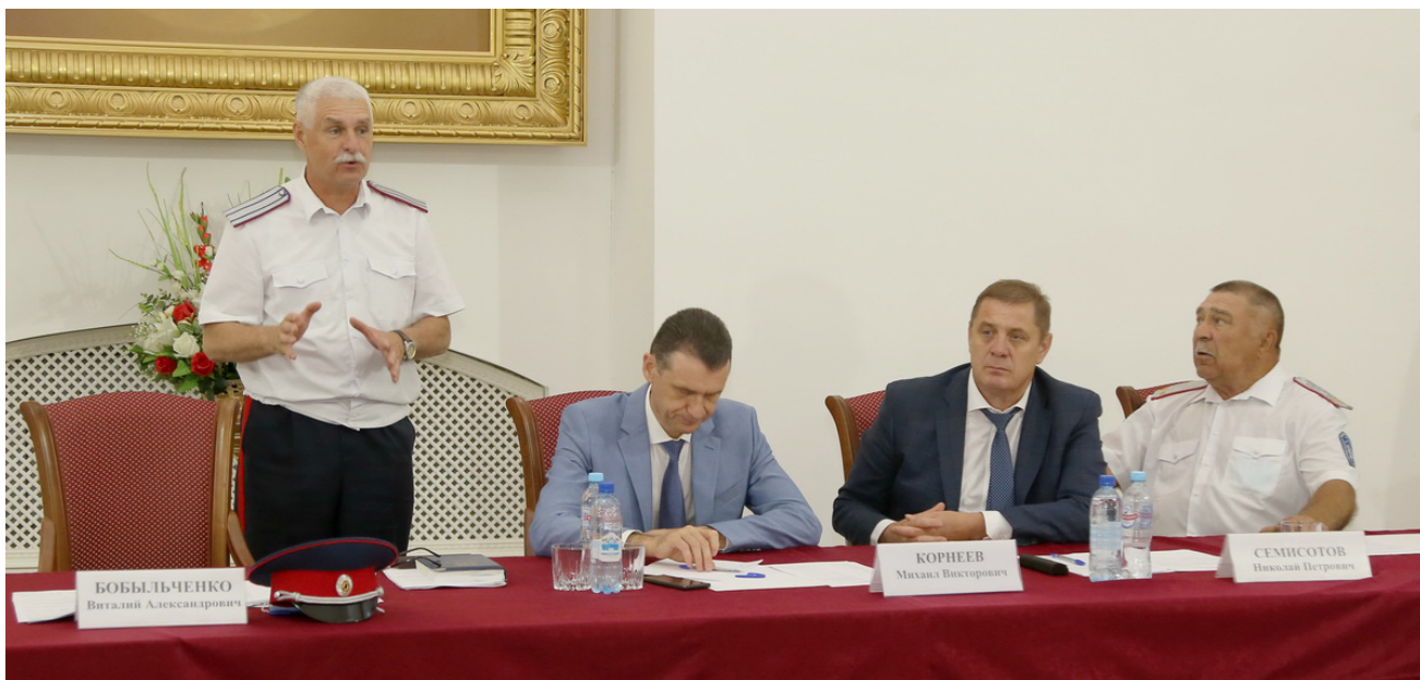
Окончание. Начало на 3-й стр.

В приветственном слове к собравшимся он отметил укрепившийся авторитет донского казачества в глазах российской общественности. Также речь шла о серьезном вкладе членов казачьих обществ в военно-патриотическое воспитание молодежи, решение ряда актуальных задач по содействию правоохранительным и природоохранным органам, работе по другим направлениям.